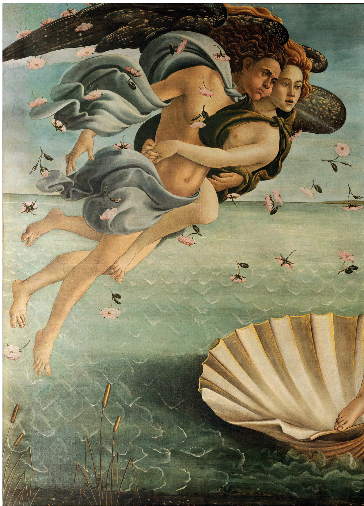
"O Nascimento de Vênus", têmpera sobre tela com dimensão de 172,5 x 278,5, pintura de Sandro Botticelli que data de 1483. A obra, que está exposta na Galeria Uffizi (Florença, Itália), inspirou as ilustrações de capa da trilogia MORRER-VIVER-NASCER. Aqui em sua completude.