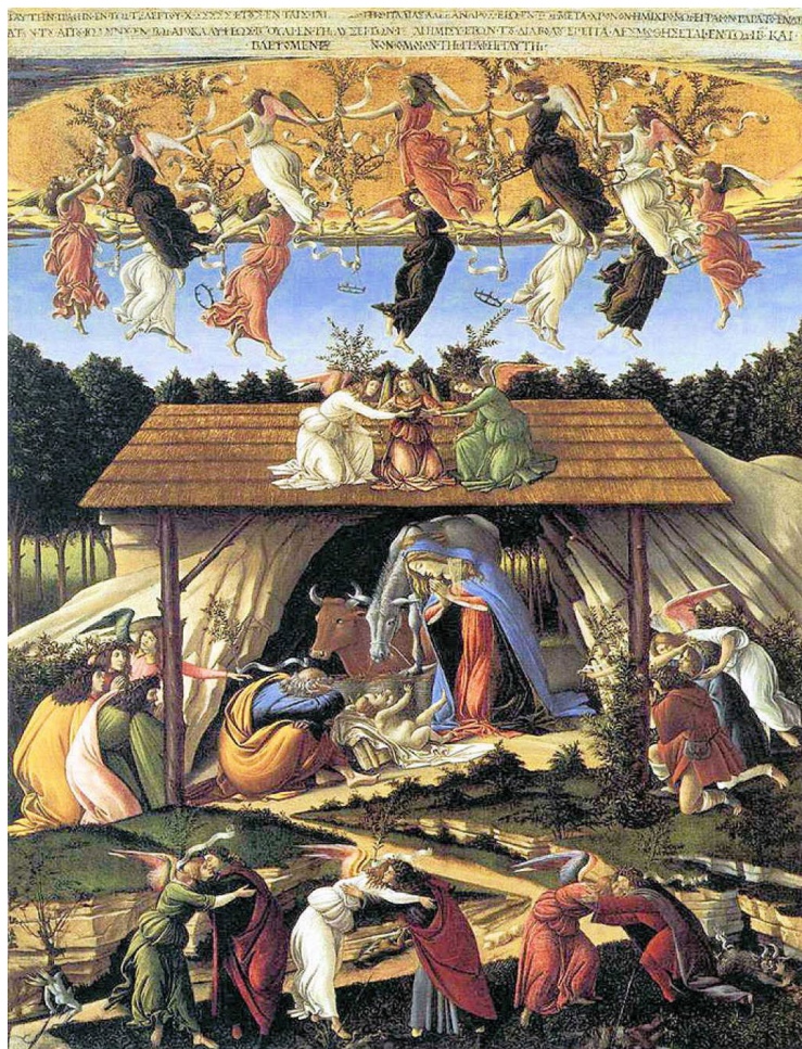
“A Natividade Mística”, de 1500-1501, a única obra assinada de Botticelli, Pintura de óleo sobre tela está exposta na Galeria Nacional de Londres.